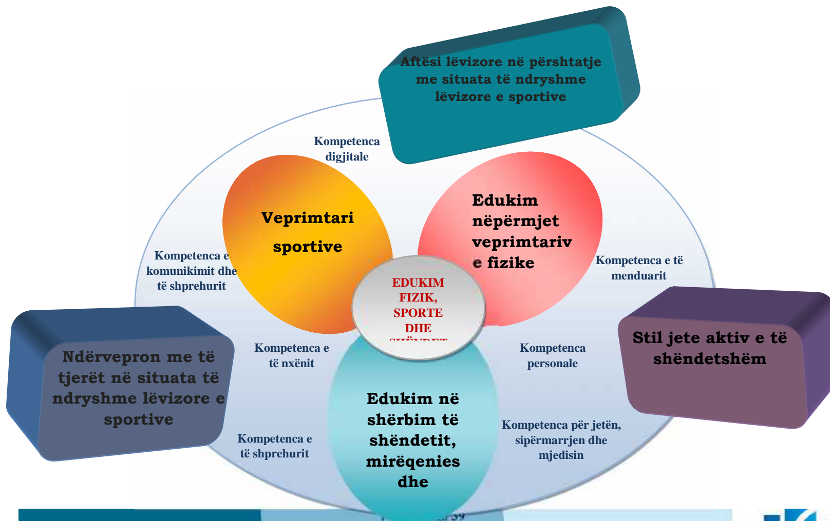
Diagrami 4: Kompetencat e fushës edukim fizik, sporte dhe shëndet dhe tematikat e fushës

Fusha/ lënda “Edukim fizik, sporte dhe shëndet” synon të përmbushë tri (3) kompetencat e fushë/lëndës, të cilat lidhen me kompetencat kyçe që një nxënës duhet të zotërojë gjatë jetës së tij dhe që arrihen nëpërmjet 3 tematikave kryesore.