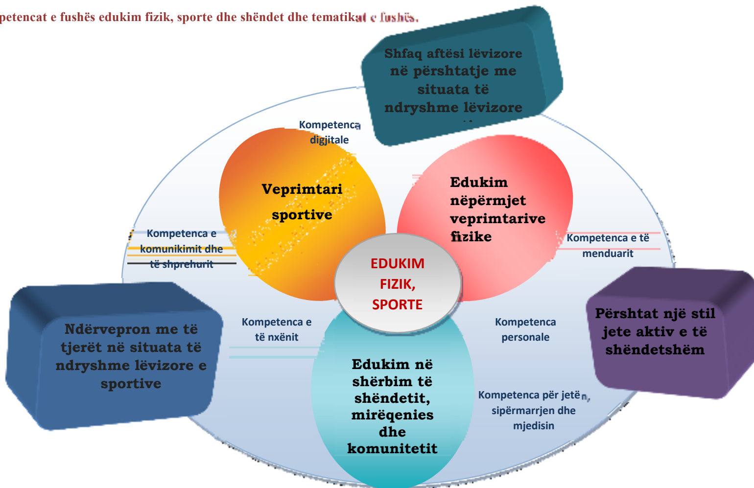
Diagrami4: Kompetencat e fushës edukim fizik, sporte dhe shëndet dhe tematikat e fushës.

Bazuar në këtë kurrikul, fusha/ lënda “Edukim fizik, sporte dhe shëndet” synon të përmbushë 3 kompetencat e fushës/lëndës, të cilat lidhen me kompetencat kyçe që një nxënës duhet të zotërojë gjatë jetës së tij dhe që arrihen nëpërmjet 3 tematikave kryesore.